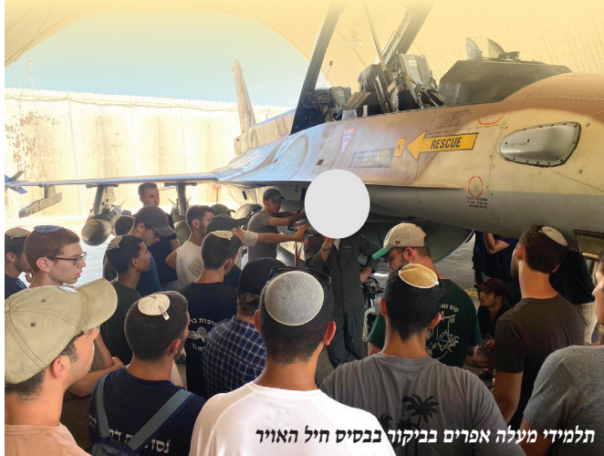
תלמידי מעלה אפרים בביקור בבסיס חיל האוויר