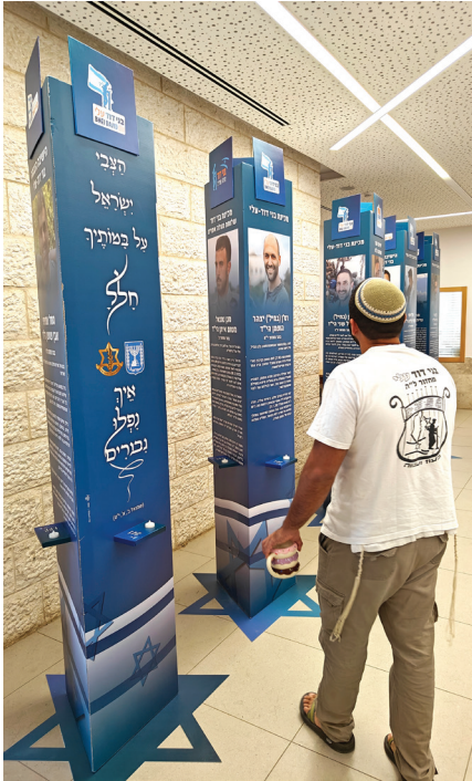
עמודי הזכרון לע"נ בוגרי בני דוד הנופלים

אלפי בוגרי מוסדות 'בני דוד' שותפים בלחימה בכל הגבולות ביבשה, באוויר ובים, וליווינו אותם ואת משפחותיהם בשנת הלחימה. ארגנו פעילויות רבות לתמיכה במשפחות הלוחמים, ובהן גם מופע של אברהם פריד בבנייני האומה. לצערנו נפלו בקרבות 24 בוגרים יקרים שלנו. אנו בקשר עם המשפחות, מפקים סרטונים לזכרם