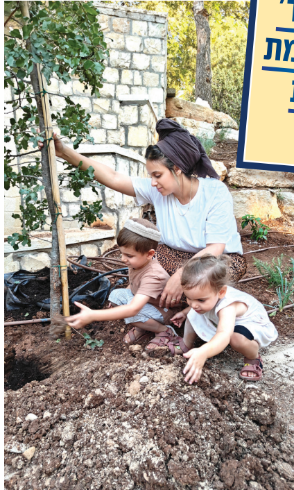
נטיעת עצים לעילוי נשמת הנופלים