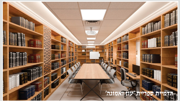
הדמיית ספריית 'עוז ואמונה'